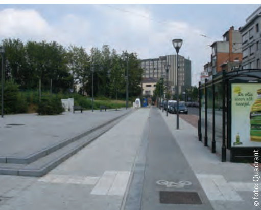
Het pleintje werd geconcipieerd als rustpunt langs de stedelijke invalsweg