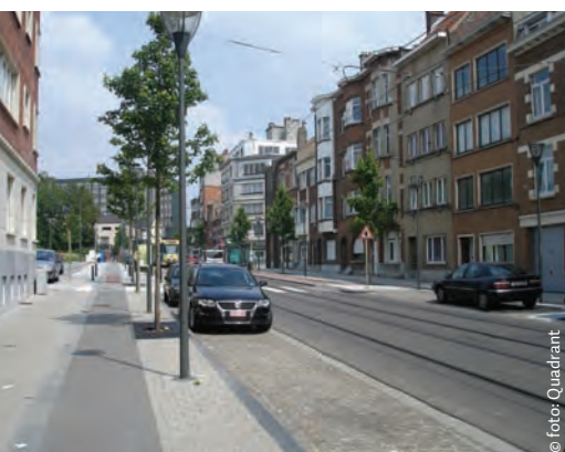
Duidelijke scheiding van verkeersstromen

Een viertal slagzinnen waren de basis voor communicatie met de omwonenden: