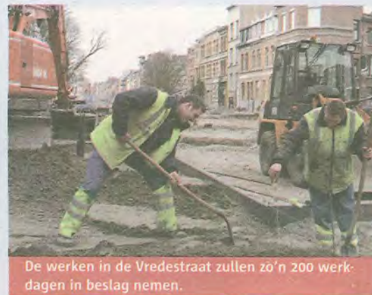
De werken in de Vredestraat zullen zo'n 200 werkdagen in beslag nemen.