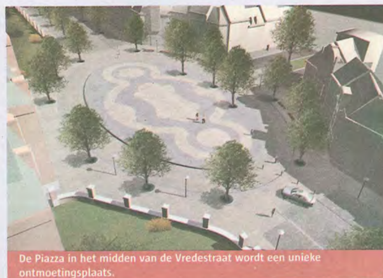
De Piazza in het midden van de Vredestraat wordt een unieke ontmoetingsplaats.

Een eerste belangrijke randvoorwaarde was dat het een 'be-leefbaar' plein moest worden. Daar konden geen toegevingen op worden gedaan. Tegelijk moesten de bussen van De Lijn de straat aan het begin nog doorkunnen, mochten er geen parkeerplaatsen verloren gaan en vroeg men rekening te houden met de bomen die nog gezond zijn. In het laatste stuk van de Vredestraat, richting Grotesteenweg, bevinden zich ook heel wat garage-inritten waarmee moest rekening gehouden worden.