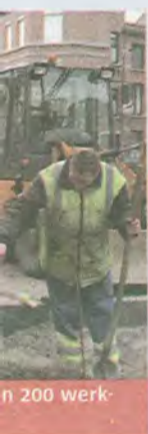
n 200 werk

t geopend bij tatie van de aat werd nog meter breed ar later werd rotesteenweg door het ge- oedelijk door ar het woord r het bestuur