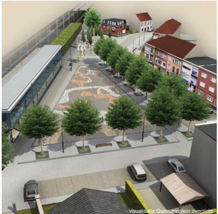
visualisatie Quitmannplein overzicht