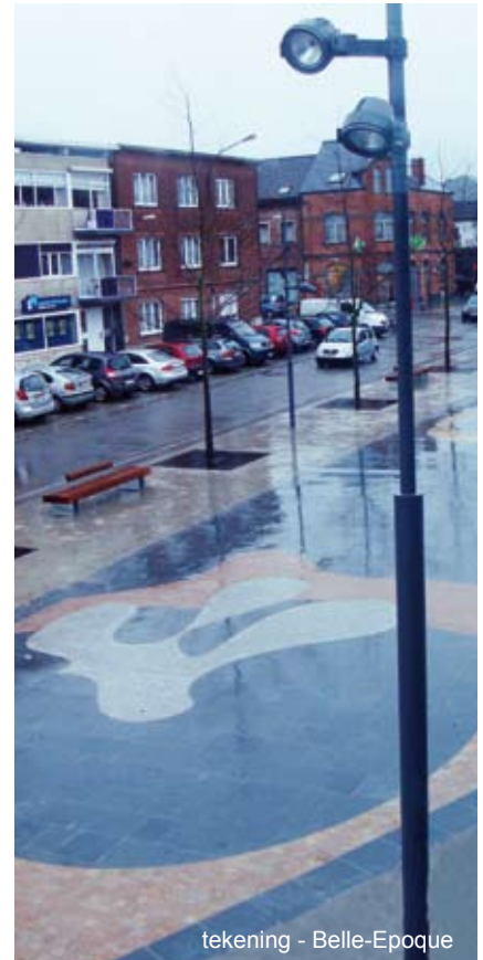
tekening - Belle-Epoque