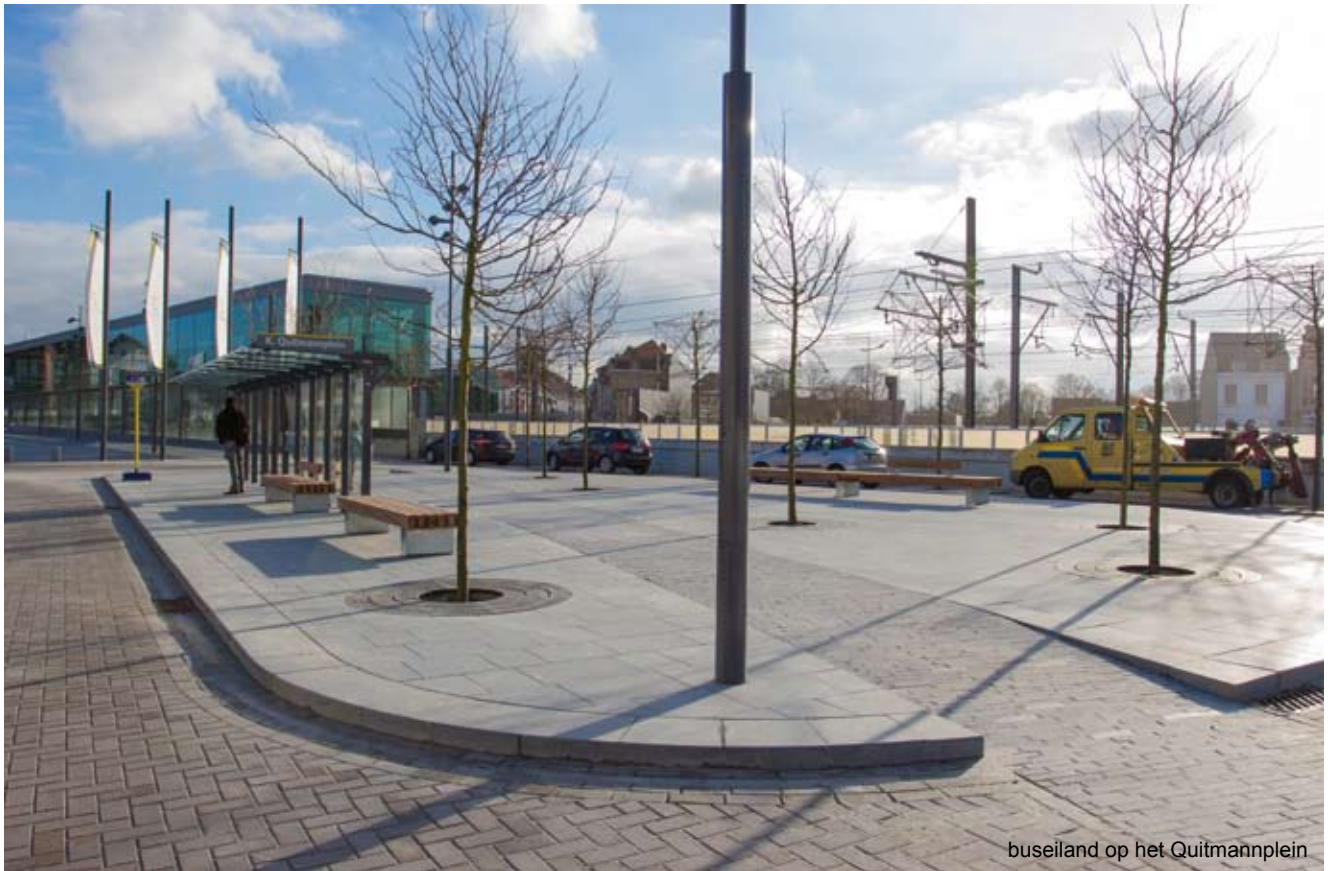
buseiland op het Quitmannplein