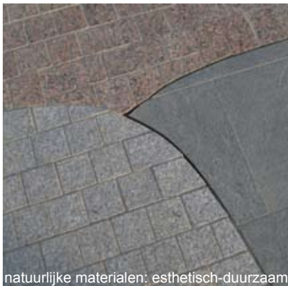
natuurlijke materialen: esthetisch-duurzaam