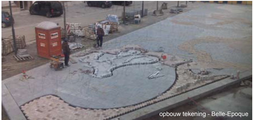
opbouw tekening - Belle-Epoque