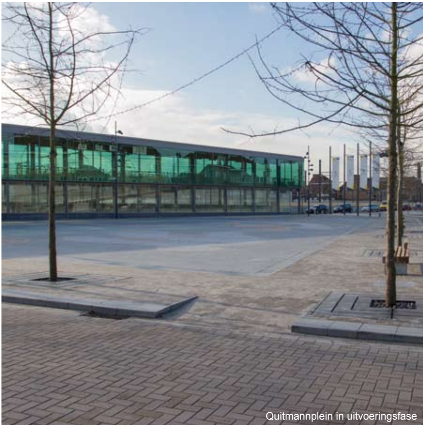
Quitmannplein in uitvoeringsfase